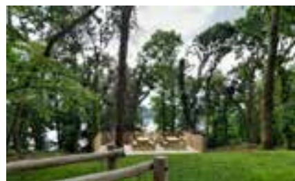
Le belvédère, point de vue remarquable