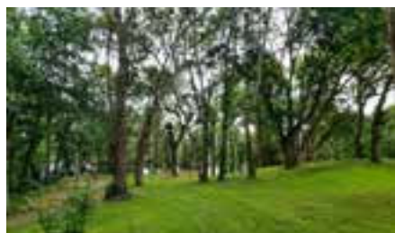
Le travail des bénévoles