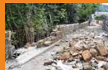
L'affaissement du mur rue du Trieux qui a nécessité la réfection complète de la chaussée