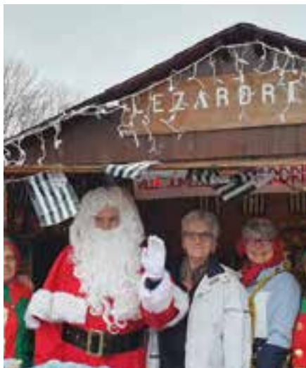
Le marché de Noël à Merangis