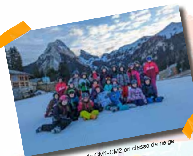
Les élèves de CM1-CM2 en classe de neige