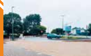
Aire intermodale de la Balise