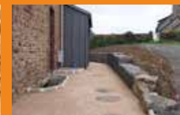
Aménagement de l'accès à l'arrière de la Cambuse