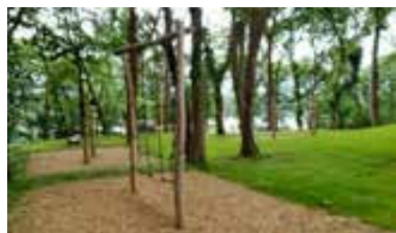
Le parcours santé