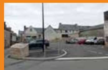
Création du parking des écoles

Nous tenons aussi à remercier les services techniques et espaces verts pour leur collaboration active dans ce projet.