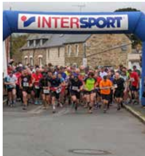
La 3ème édition de la course du Lézard qui a réuni cette année 169 coureurs