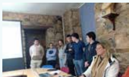
Les élèves du lycée de Pommerit présentent leur travail aux élus

Nous remercions chaleureusement les lycéens pour leur implication dans ce projet.