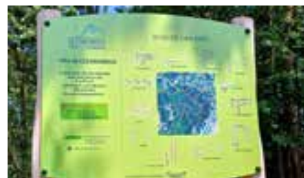
Le panneau d'accueil du parcours santé