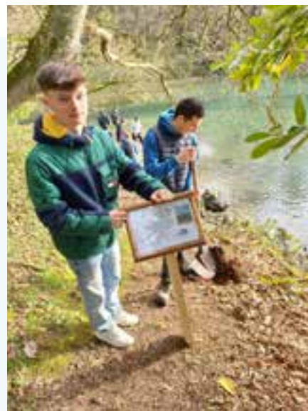
Mise en place d'un panneau explicatif sur le GR34

Un grand merci à tous les bénévoles qui ont participé au défrichage et nettoyage du bois avant l'installation des équipements sportifs.