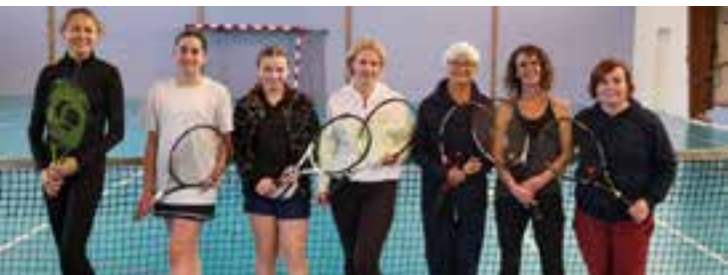
L'équipe féminine du Tennis Club

Le club propose des stages d'initiation ou de perfectionnement pendant les vacances d'été. Ils se tiennent dans la salle omnisports.