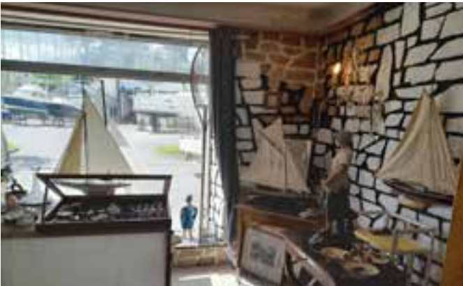
Lez'Art Antik, sur le Port depuis 2023

La boutique est ouverte tous les jours, sauf le dimanche et vous attend, curieux ou passionnés d'objets singuliers.