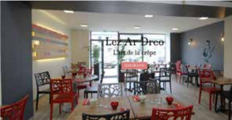
Le Lez Ar Dreo a réouvert ses portes avec une nouvelle équipe

Crêperie Lez Ar Dréo, ouverture à partir du 12 avril jusqu'à mi-novembre 2024, midi et soir, du mercredi soir au dimanche soir, jusqu'en juillet, le lundi également, en juillet, août et septembre