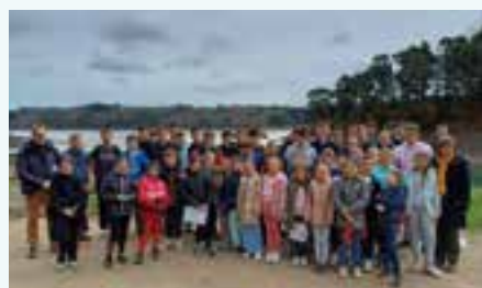
Les élèves du lycée de Pommerit et la classe de CM1/CM2