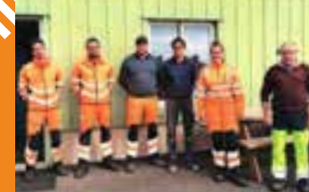
Merci aux agents des services techniques