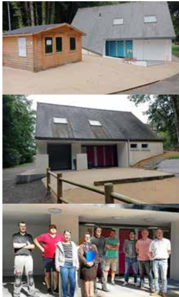
Réception des travaux au camping municipal avec les entreprises et les agents des services municipaux