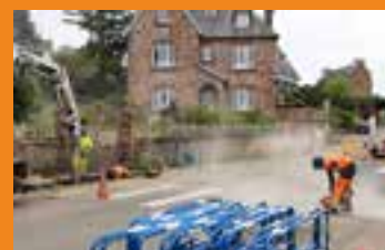
Rénovation du réseau d'eaux pluviales au port