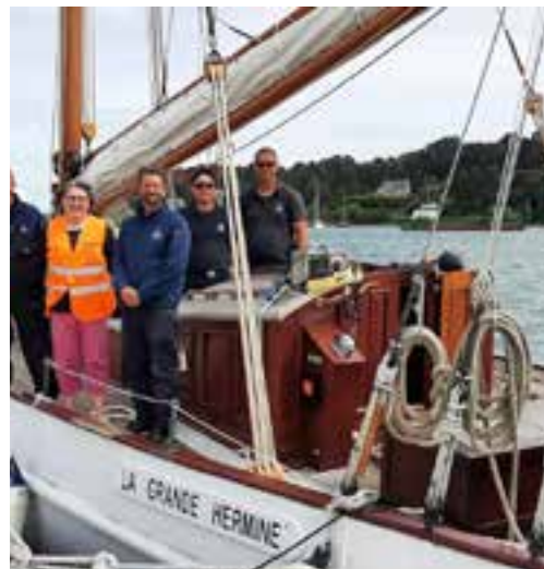
La grande Hermine en visite au port de plaisance