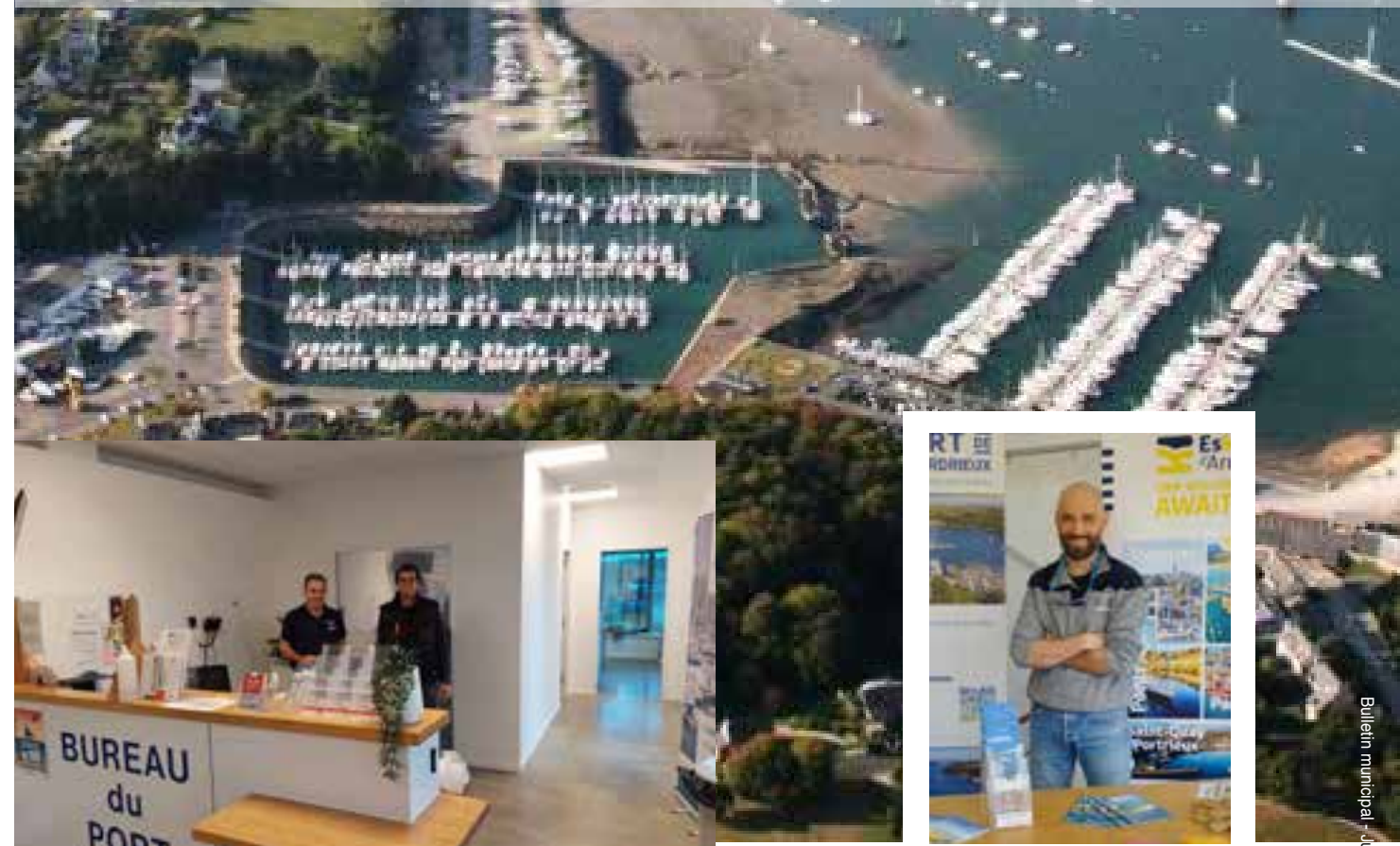
Le réaménagement du bureau du port par des entreprises CISO STYLE : plafond, cloisons / IMS : Réseau et la peinture en Régis

Adjoint au maire de Lézardrieux Affaires Portuaires, Associatives, Tourisme