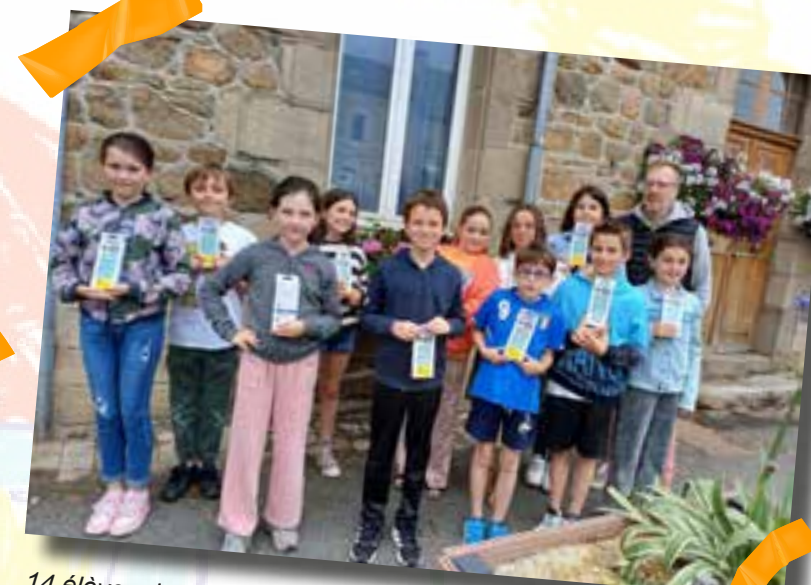
14 élèves de CM2 vont quitter l'école de Lézardrieux pour rentrer en 6 ème . La municipalité leur a offert une calculatrice pour bien démarrer leur entrée au collège.